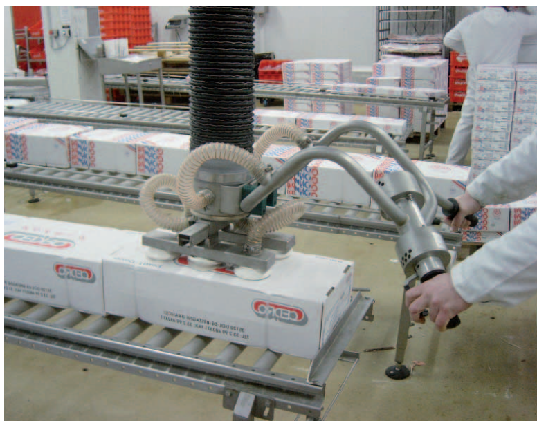
Manipulateur de cartons à ventouses.

Vous palettisez ou dé-palettisez des cartons pouvant atteindre 50 KG voire plus à une fréquence importante ? Nos solutions d'aide à la manutention permettent de manipuler vos charges en protégeant l'opérateur.