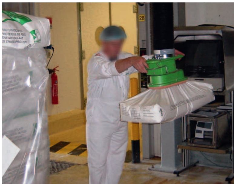
Manipulateur de sacs.