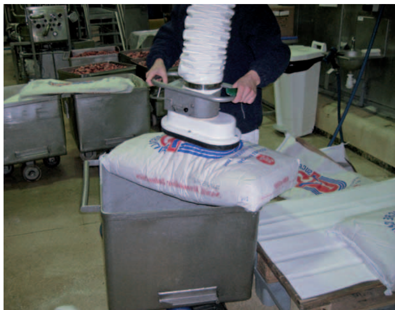
Manipulateur à ventouse pour sac.

Vous levez des sacs de 25 à 50 KG pour alimenter votre trémie ? Nos systèmes d'aide à la manutention à ventouses vous permettent de manipuler vos sacs en papier ou en plastique en supprimant la pénibilité sur le poste de travail.