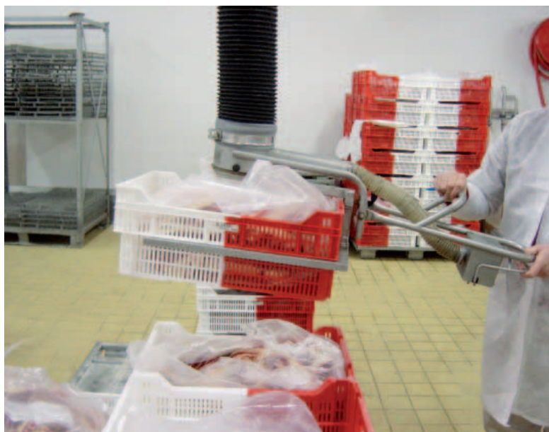
Manipulateur bac à fourches.

Vous devez palettiser, dé-palettiser ou transférer des bacs pouvant atteindre 50 KG voire plus à une fréquence importante ? Nos solutions d'aide à la manutention par ventouse ou mécanique permettent de manipuler vos charges en protégeant l'opérateur.