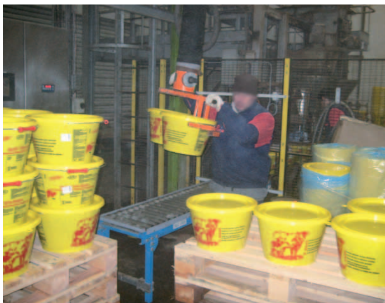
Manipulateur à fourches pour bidons x 2.