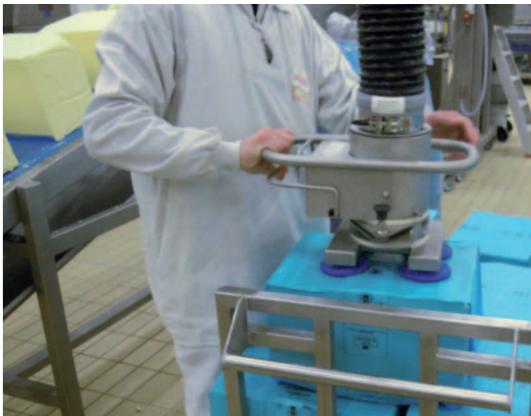
Manipulateur à ventouses pour mottes de beurre.