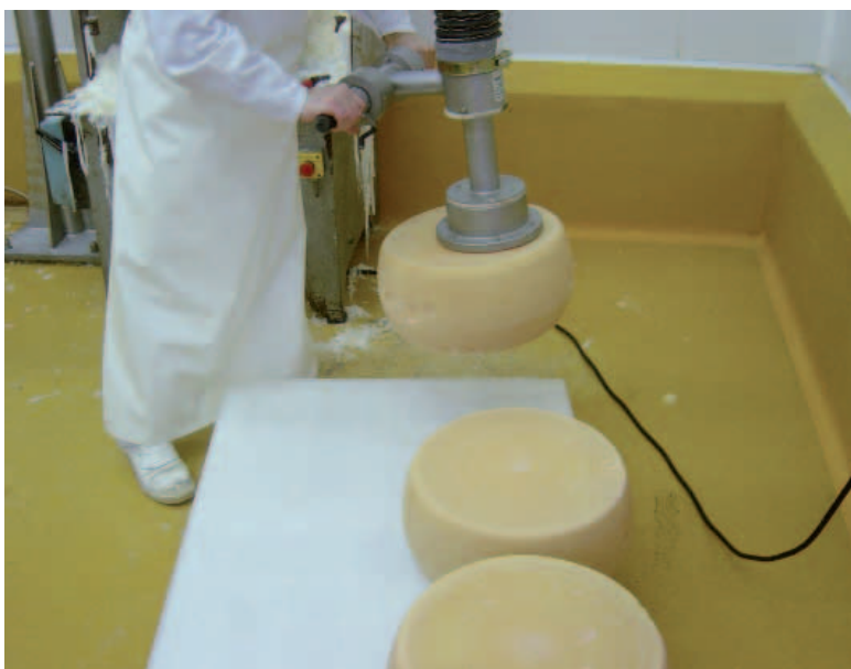
Manipulateur à ventouse en inox.