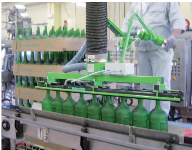
Manipulateur pour bouteilles - Construction spécifique.

Vous palettisez ou dé-palettisez des bouteilles par rangée ? Nos solutions d'aide à la manutention permettent de manipuler vos charges en améliorant la productivité du poste et en protégeant l'opérateur.