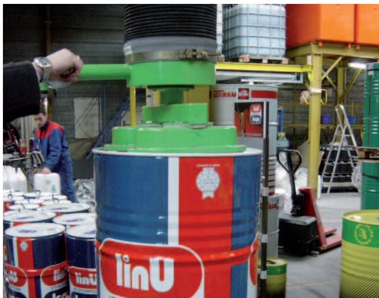
Manipulateur à ventouses pour fût.

Vous manutentionnez des fûts pouvant atteindre 250 KG ? Nos solutions d'aide à la manutention permettent à un seul opérateur de manipuler vos fûts en toute sécurité.