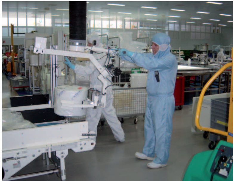
Basculeur pneumatique pour bobines. Construction spécifique.