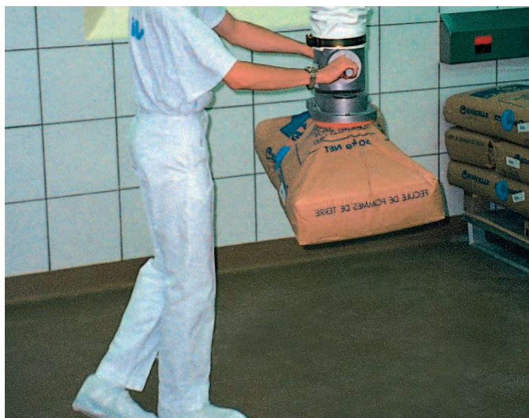
Manipulateur de sac en inox.

Vous transférez vos charges (sacs, cartons, fûts, bidons, etc.) d'une palette bois vers une palette plastique dédiée à la production ? Nos systèmes à ventouses vous permettent de manipuler vos charges en supprimant la pénibilité sur le poste de travail.