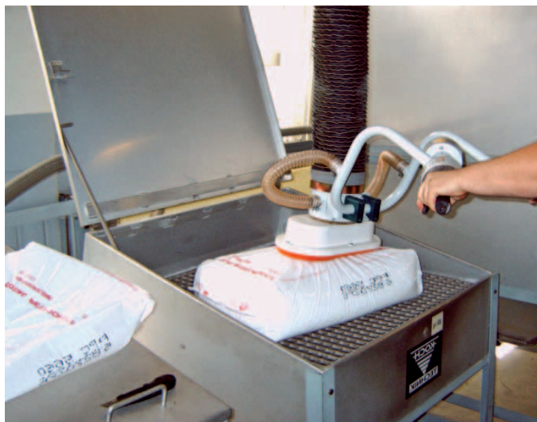
Manipulateur de sac avec poignée ergonomique.

Vous soulevez des sacs de 25 à 50 KG pour alimenter votre trémie ? Nos systèmes à ventouses MANUT-LM vous permettent de manipuler vos sacs en papier ou en plastique de 25-50 KG en supprimant la pénibilité sur le poste de travail.