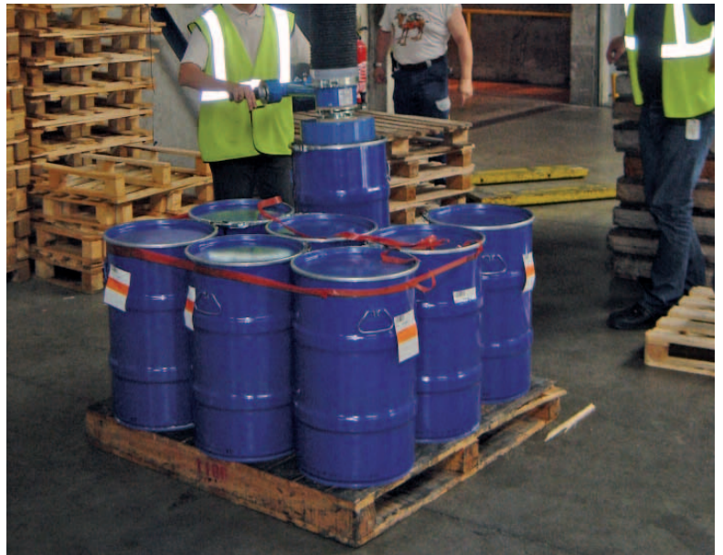
Manipulateur de fût.