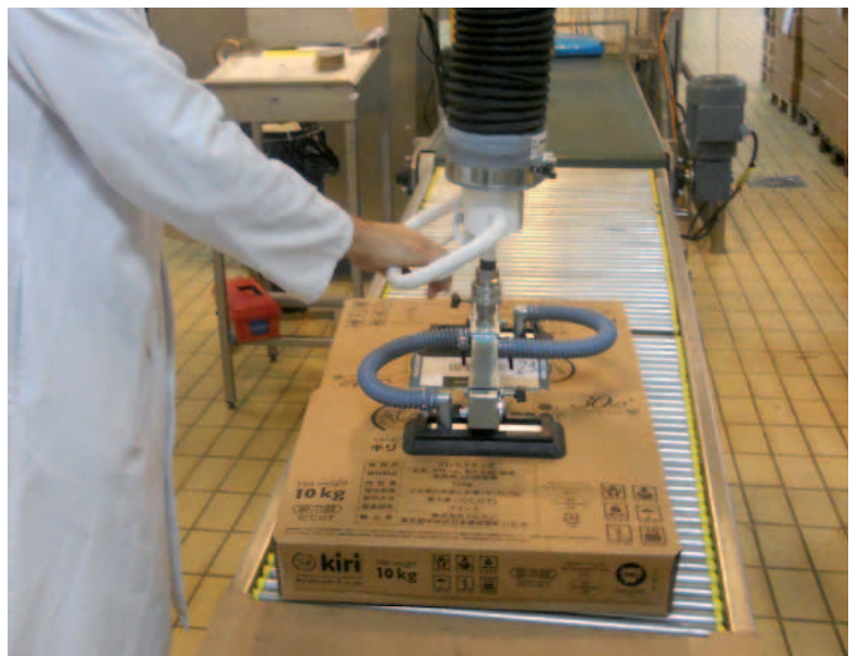
Palettisation de cartons.