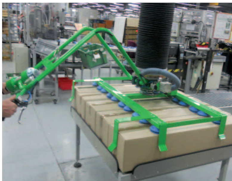
Manipulateur à ventouses avec poignée ergonomique.

Vous palettisez ou dé-palettisez des cartons à une fréquence importante ? Nos solutions d'aide à la manutention permettent de manipuler vos charges en protégeant l'opérateur.