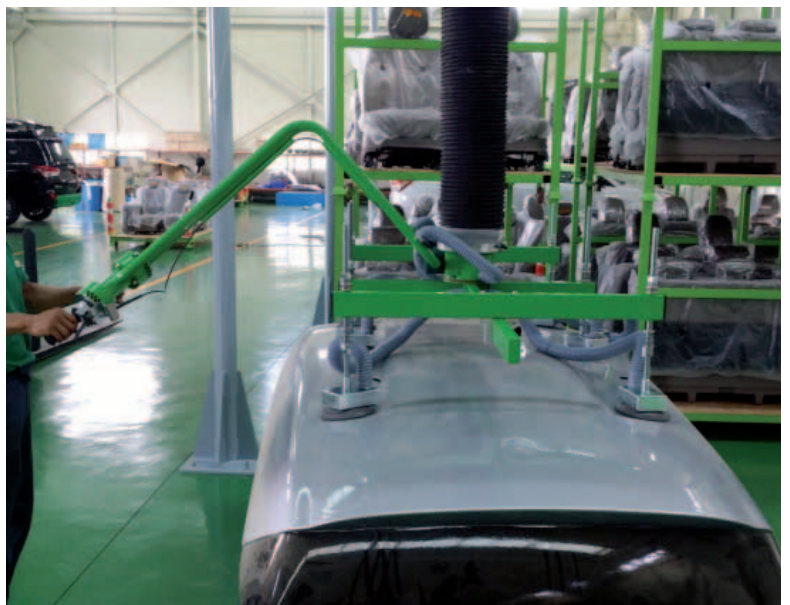
Manipulateur à ventouses avec poignée ergonomique.