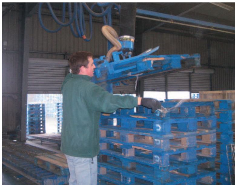
Manipulateur à fourches pour palettes.

Vous manipulez des palettes pour alimenter vos postes de conditionnement ? Nos solutions d'aide à la manutention permettent d'effectuer cette opération en protégeant l'opérateur des risques liés à cette opération.