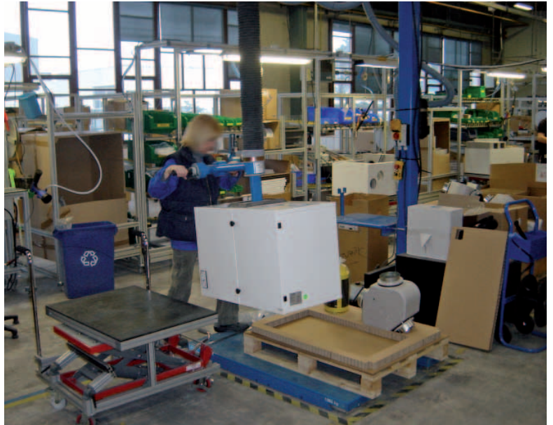
Manipulateur à ventouses.