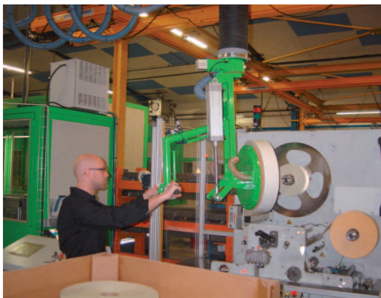
Basculeur bobine pneumatique - Construction spécifique.

Vous manipulez des bobines avec basculement ou non pour alimenter une machine, un convoyeur ou une palette ? Nos solutions d'aide à la manutention permettent d'effectuer ces opérations en protégeant l'opérateur tout en respectant la charge.