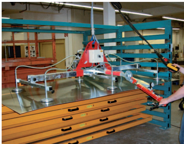
Palonnier à ventouses.

Vous manipulez des tôles ou des panneaux plastiques de formats variés pour alimenter vos machines de découpe ? Nos systèmes à ventouses permettent à un seul opérateur de manipuler vos tôles en supprimant la pénibilité sur le poste de travail.